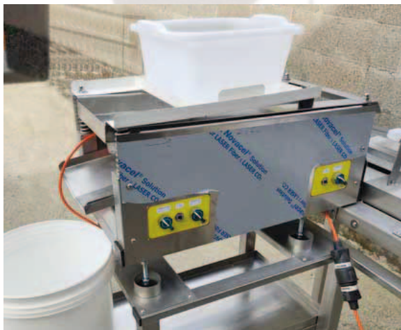
Art. PR0102 - VIBROVAGLIO VENTILATO