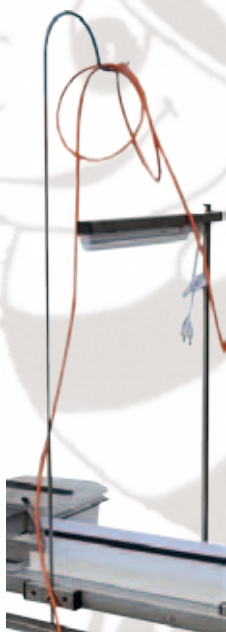
Art. PR0106 - ILLUMINAZIONE PER TAPPETO