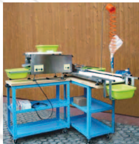
Art. PR0105 - TAVOLI DI SUPPORTO INDIPENDENTI IN FERRO VERNICIATO MONTATI SU RUOTE